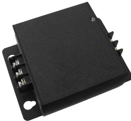
Рис. 1 Внешний вид устройства