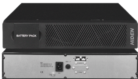
Внешний вид батарейного кабинета