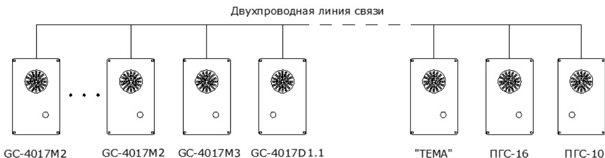
Рисунок 2. Структурная схема системы связи «один говорит – все слушают».

На рис.2 приведена структурная схема системы связи «один говорит – все слушают».